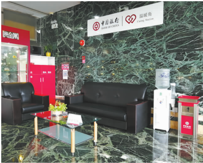
文/图 记者 梁展宏

“外面正下着雨,这里有雨伞可供使用,你走的时候先拿去用吧。”如今,在中国银行中山市分行每个网点的营业大厅,工作人员都会提示大家有这样一角:沙发、饮水机、老花镜、针线包、小药箱、轮椅、充电器、杂志书报、雨伞、茶包、微波炉等便民设施一应俱全。记者了解到,继去年9月底首度推出“中行温暖角”便民服务后,今年来中国银行中山分行已在全市56个网点基本完成该项便民服务的搭建和改造,对城市公共服务人员及需要关爱群体的服务延伸到全市各大镇区。