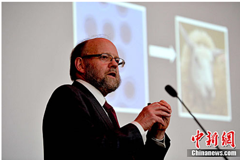
克隆羊“多利”之父 Sir Ian Wilmut

据香港《文汇报》报道，20年前的7月5日，全球首只克隆羊“多利”诞生。当时科学家希望多利的出生，有助他们研究治疗部分疾病的方法，但克隆动物同时引起在科学及道德上的争议，担心有朝一日人类亦会被用作克隆。