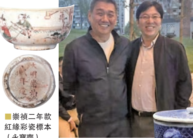
崇禎二年款紅綠彩瓷標本(永寶齋)