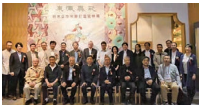
一眾嘉賓參與展覽開幕禮