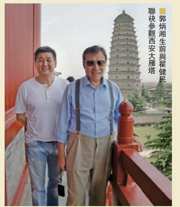
郭炳湘生前與翟健民聯袂參觀西安大雁塔

郭炳湘對收藏古玩的態度及品味，並非只盯着物件的價格，逾億珍品他固然有能力拿下，但只要是自已真心喜歡的，數千元的他亦珍愛重之，只要自已真心喜歡就深感滿足。他的藏品聘有專人管理，有清晰記錄，擺設在寫字樓的，經常變換交替欣賞。翟健民強調，郭炳湘是一位真正熱愛中國古玩藝術的藏家，奈何天不假以年，太可惜了！