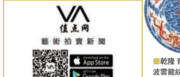
乾隆 青花鑲紅水雲龍紋折沿大盤

11月6日，佳士得倫敦將在倫敦國王街總部舉行「中國瓷器及工藝精品」拍賣，匯聚一系列重要私人珍藏的青銅器、高古瓷、明清瓷、佛像造像、黃花梨傢俱、玉