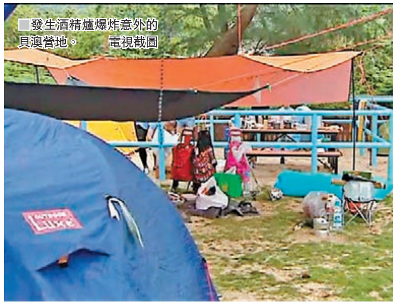
發生酒精爐爆炸意外的貝澳營地。電視截圖

疑爐具未熄火「加料」肇禍 其中一名男傷者的友人事後稱,懷疑爐具仍屬高溫或火焰未完全熄滅情況下,有人心急補加燃料引致搶火爆炸。警方到場將燃料罐檢走等候進一步檢驗。 過往曾發生煮食爐爆炸意外。2003年11月,3名女童軍在元朗的康樂中心營地接受烹飪訓練時,懷疑有人燃點其中一個酒精爐時突搶火,3人走避不及被燒傷,其中一名女童軍遭嚴重灼傷,衣衫着火慘成「火人」,送院後證實身體有四成燒傷,一度命危。有專家指,日光白下燃點酒精產生的藍色火焰不易被肉眼察覺,使用者在添加酒精時容易釀成搶火。