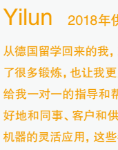
Yilun 2018年供应链实习生 德国卡尔斯鲁厄理工学院

2016年，我作为实习生加入了巴斯夫，开启了我的职业生涯。在半年的实习时间里，我有幸观摩了一体化的生产基地，接触到了系统化的设备体系，更深刻体验到了现代化的生产理念。这些，对我未来的职业发展启到了很重要的影响。现在，我已经在巴斯夫工作快两年，正式地成为了巴斯夫的一份子，更是被巴斯夫的责任关怀和工匠精神所感染，期待自己能在未来的日子中为巴斯夫带来更多的活力与力量。