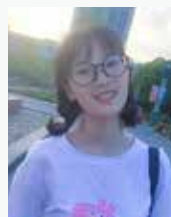
Cherry 2018年研发实习生 江南大学

从德国留学回来的我，对巴斯夫一直是情有独钟。在巴斯夫实习的这些时日，让我得到了很多锻炼，也让我更加确定之后的就业方向。作为职场小白，很感谢部门领导时常能给我一对一的指导和帮助。在巴斯夫包容、开放、提倡创新的工作环境中，让我可以更好地和同事、客户和供应商进行有效的沟通，同时也让我认识了更多的完善流程以及机器的灵活应用，这些都为我之后的学习深造提供了许多新的方向。