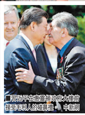
■習近平在惠靈頓政府大樓前接受毛利人的碰鼻禮。