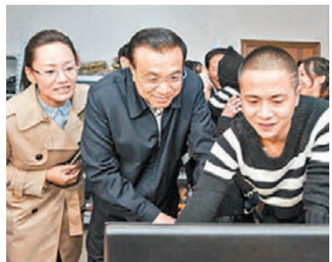
■李克強在青岩劉村一家經營親子裝的網店。

中新社電 中國國務院總理李克強19日在浙江考察時到訪了義烏市青岩劉村。青岩劉村地處義烏市的南邊。據公開數據顯示，該村聚集了來自中國各地15000餘名從事網絡銷售及相關產業的工作人員，2800多家註冊網店每天向世界各地賣出超過3000件各類商品。青岩劉村也被稱為中國「網店第一村」。