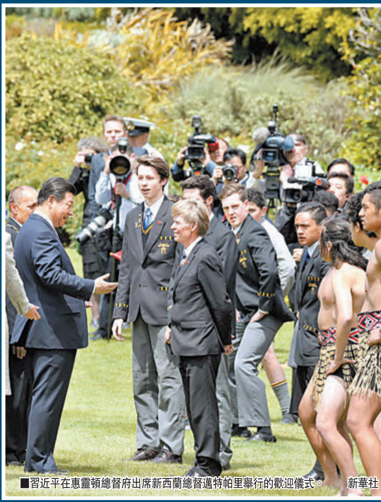
■習近平在惠靈頓總理府出席新西蘭總理邁特帕里舉行的歡迎儀式。