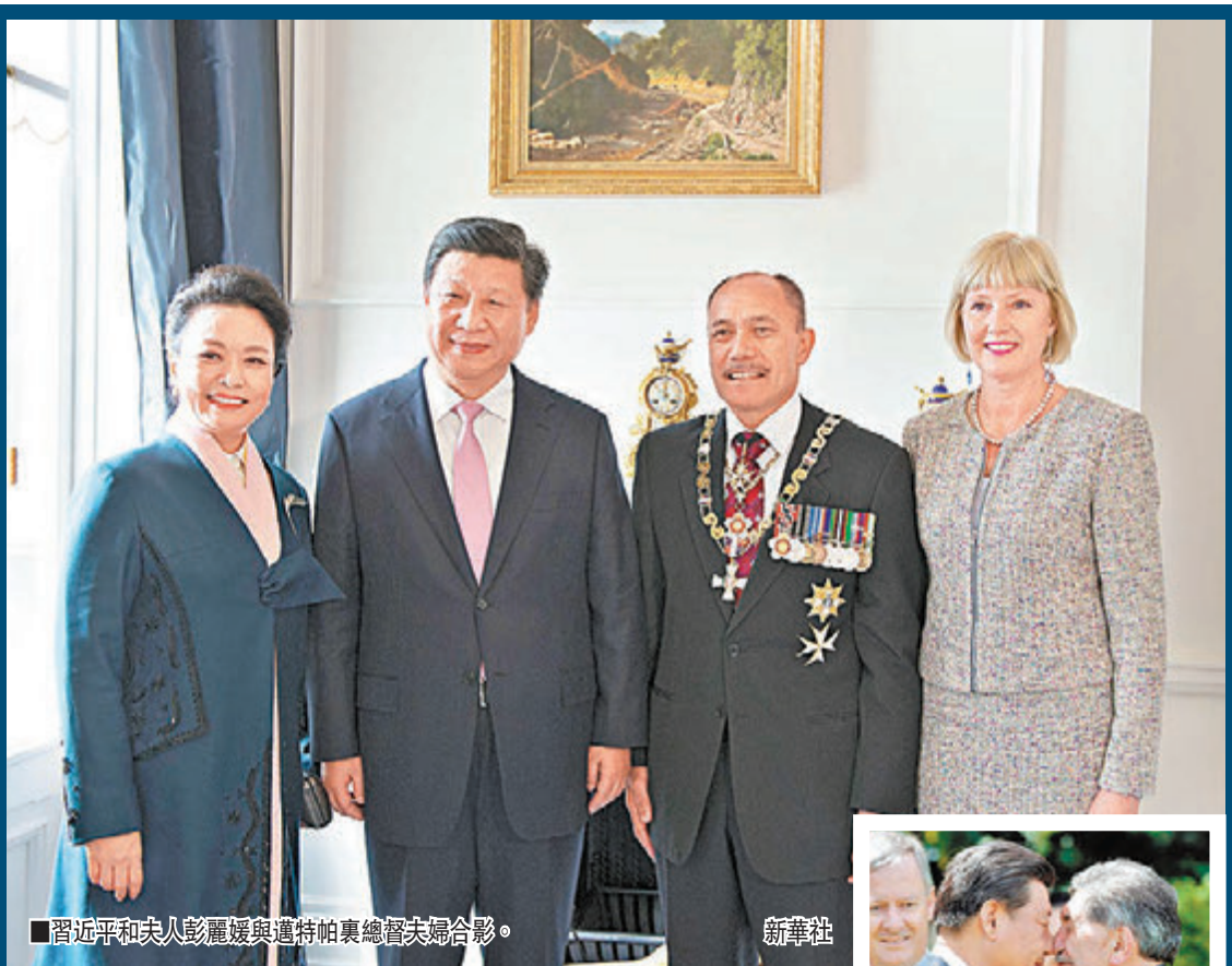
■習近平和夫人彭麗媛與邁特帕里總理夫婦合影。

習近平和約翰基共同見證了多項雙邊合作文件的簽署，涉及氣候變化、電視、教育、南極、金融、旅遊、食品安全等領域。