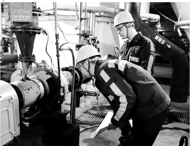
近日,建设集团洗选煤运营公司开展了节前安全大检查活动。由公司班子成员及机关各部室成员组成专项检查小组,对各项项目逐一进行了“拉网式”现场隐患排查。因为检查组正在对设备进行检查。

本报 “姚队长,你得了多少分?”“我考了92分。”……4月24日上午,考场外大家聚在一起热烈交流着考试题目和成绩。铜川矿业公司玉华煤矿全员安全培训考试中心当日投入运行,迎来了包括矿党政班子成员、工程技术人员、班组长和特种工种等本月第一批60名“考生”,自此全矿人人将迎来安全知识“月考”。 建成全员安全培训考试系统,是今年陕煤股份针对提升煤矿从业人员安全素养而推出的一项事关安全生产的重大举措。该矿认真贯彻落实上级决策部署,利用现有场所建设考试中心,配备60台考试专用电脑等硬件设施,联网安全知识题库,并添置电教设备,建成了集考试、教学于一体的网络化、信息化安全学习教育系统。 培训考试中心投入运行后,秉承“管理、装备、素质、系统”并重的原则,不仅业务科室、基层单位安全管理人员,班组长和特种工种要定期进行安全培训参加上机考试,还包括矿井领导班组成员和党务、经营及地面辅助单位等全矿所有人员必须每月参加一次安全“月考”,安全学习考核实现全覆盖,不漏一人,以考促学全方位提升干部职工安全素养。 考试中心设置了虹膜身份识别、身份证扫描和360度视频监控装置,考生提前预约时间完成每月月考,答题时系统根据岗位工种性质从题库随机选题,每人题目各不相同,包含选择、判断共100道题,在120分钟内完成答题,提交试卷后实现即时评分录入系统并公布成绩,80分为及格线,当月成绩不合格的人员进行补考,补考成绩合格方能上岗工作。智能化考试系统杜绝了代考、漏考、抄袭作弊现象,保障了个人信息准确、考试公平规范、成绩公开透明,促进全员安全素养的提升。(朱建锋)