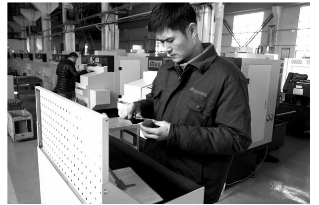
近日,澄合煤机公司以深入开展质量提升行动活动为抓手,不断优化工艺流程,精益求精制造高端产品。图为液控阀车间职工正在检测产品配件质量。

理。要以化工企业为主,开展全集团的消防安全培训、演练、问题会诊,提高消防安全工作水平。 王世斌在会上总结了集团公司煤炭板块安全生产取得成绩的原因,指出了存在的不足,要求进一步加强五个方面工作。一是切实提高认识,坚决做到超前消除隐患;二是加大“四化”投入,彻底降低安全风险;三是加大科研投入,扎实解决制约安全高效生产存在的问题;四是加强安监队伍建设,改进检查方式,为安全生产保驾护航;五是认真总结经验教训,继续保持优良传统和好的做法,坚决改正问题。 杜平在会上通报了第一季度全集团安全生产主要情况,指出第一季度集团公司实现了安全生产,安全生产形势稳定向好,但也存在一些问题。他要求提高政治站位,清醒认识当前安全环保形势,把安全环保工作作为重中之重;强化运输管理,确保企业安全;开展NOSA安健环综合管理体系实施情况调研;加强安全隐患排查,把隐患排查治理作为安全生产工作的重要抓手。 会上,陕西煤业股份有限公司、化工集团公司、长安电力公司、建设集团公司、陕钢集团公司、铁路物流集团公司、陕北矿业公司、彬长矿业公司、榆北矿业公司、神木煤化工公司、蒲洁煤化工公司等单位汇报了2019年安全生产工作开展情况。(徐宝平 巨宏伟)