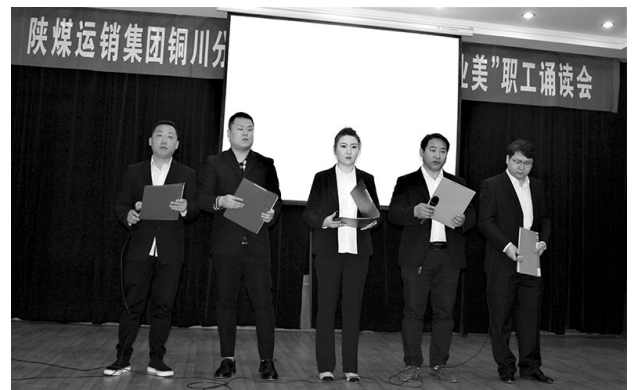
“五一”前夕,运销集团铜川分公司组织开展“劳动美、青春美、创业美”主题诵读活动,激发广大职工为实现企业高质量发展而奋斗。