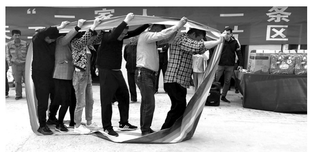
在“五一”国际劳动节来临之际,建设集团天工公司工会在陕北小保当矿业公司施工现场举办了由9个项目部50余人参加的“庆五一,一家人,一条心,一起来”职工趣味接力赛,增强了员工的团队协作精神。