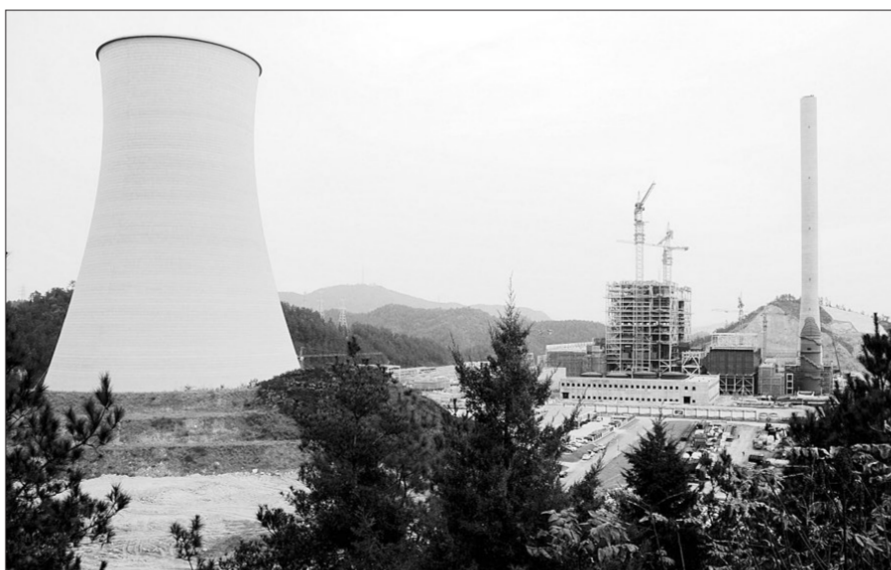
湖北省十堰市京能热电厂投资2000多万元的1号机组电除尘设备近日安装完毕,项目建成后除尘效率将达99.99%。

本次科技成果评价会由中国循环经济协会、中华环保联合会与北京生态设计与绿色制造促进会联合主办。