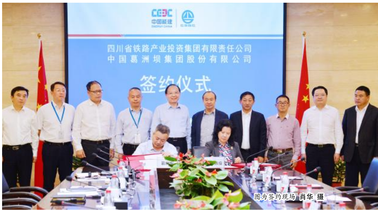
图为签约现场

孙云介绍了四川铁路概况及目前海外项目投资情况。他表示,葛洲坝历史底蕴深厚,品牌形象良好,双方