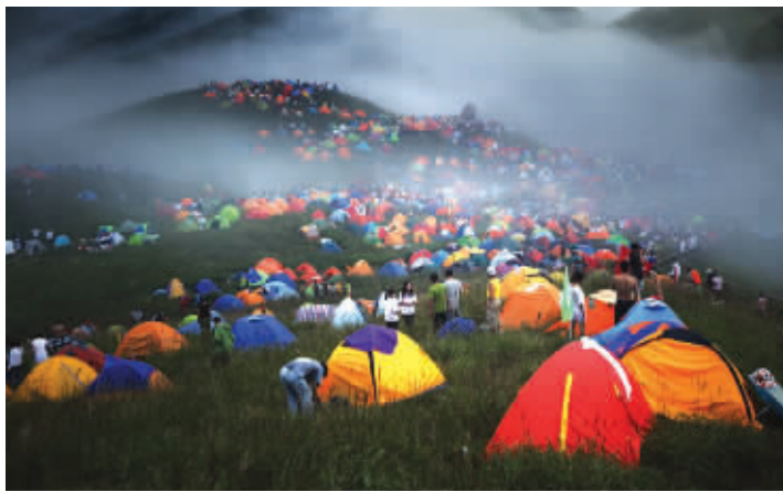
在户外纵情山水,对现代都市人来说是个奢侈的事情。