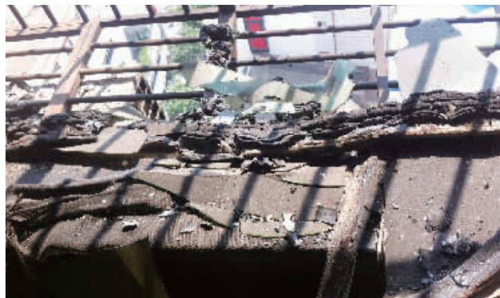
汤师傅说,事发时,楼下男女曾趴在防盗窗上呼救。图为汤师傅家卧室窗台,楼下即为发生火灾的909房。

本报8月28日讯 今天凌晨1时20分左右,株洲芦淞区金园大厦突发大火,导致6人死亡。虽然事发楼层为9楼,但因系复式楼,实际高度为18层。高层建筑火灾安全再次敲响警钟。