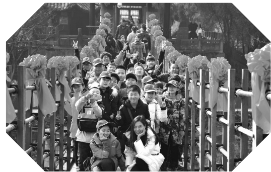
世纪明德川蜀研学营 孩子们带着课题行走