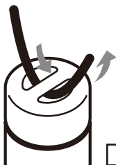
吊飾鉤環非附屬品。

注意 電池蓋請確實轉緊。 於使用中電池蓋若鬆脫可能導致受傷或故障。 請勿拿著加裝的吊飾鉤環用動本體，或強力拉扯。 可能造成他人受傷或其他物品破損。