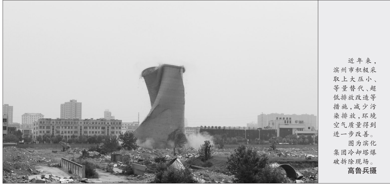
近年来,滨州市积极采取上大压小、等量替代、超低排放改造等措施,减少污染排放,环境空气质量得到进一步改善。图为滨化集团冷却塔爆破拆除现场。