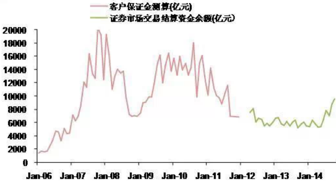
图：客户保证金突破万亿