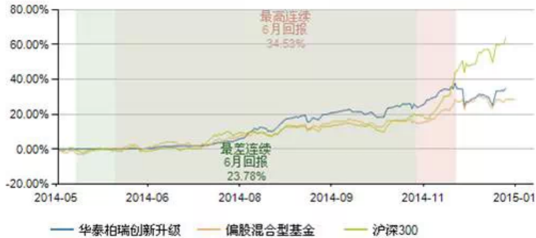
图：华泰柏瑞创新升级业绩表现