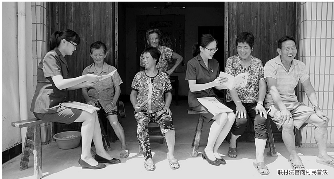
联村法官向村民普法

按片区划分确定法官或法官助理联系的村、社区;深度对接浙江省基层治理体系“四平台”;与相关部门建立重大纠纷联调机制,实现纠纷化解“1+N”化;编辑《水哥法官工作室简报》;开展“巡回审判、百姓评案”……一系列措施推动“水哥法官工作室”迈上新的台阶,原有的20个工作室站点“连锁”至100个,实现辖区全覆盖。2017年以来,双林法庭已开展联村服务128次,培训人民调解员113人次,将490起纠纷化解在人民调解阶段。该庭先后获得最高院授予的集体一等功、全国法院先进集体等荣誉,并三次获评省级模范“五好”法庭称号。