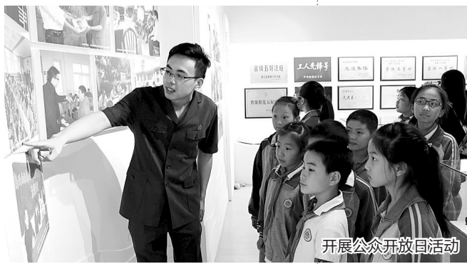
开展公众开放日活动

2017年以来,练市法庭已累计向辖区各村、社区、企业开展普法活动86次,累计普法1100余人次,发放《企业常见经营法律风险提示及防范建议60例》1300余册,向企业发送司法建议4条,受到广泛好评,并多次获得市级集体三等功等荣誉。