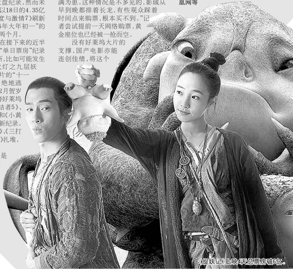
《捉妖记》上映4天总票房破6亿。