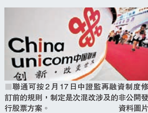
聯通可按2月17日中證監再融資制度修訂前的規則，制定是次混改涉及的非公開發行股票方案。

就在該公告披露半個小時後，中證監亦公告稱，對聯通非公開發行作個案處理。據中證監新聞稿指，中證監經與國家發展改革委等部門依法依規履行相應法定程序後，對中國聯通混改涉及的非公開發行股票事項作為個案處理，適用2017年2月17日證監會再融資制度修訂前的規則。中證監並指，「中國證監會認真學習貫徹落實黨中央、國務院關於深化國有企業改革的決策部署，深刻認識和理解中國聯通混改對於深化國企改革具有先行先試的重大意義。中國聯通已在國家發展改革委等部門指導下制定了混改方案。」