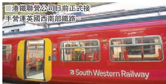
港鐵聯營公司日前正式接手營運英國西南部鐵路。

香港文匯報訊 港鐵(0066)與FirstGroup plc合組的聯營公司正式接手營運英國西南部鐵路，成為該國其中一個最大規模鐵路專營權的新營運商，