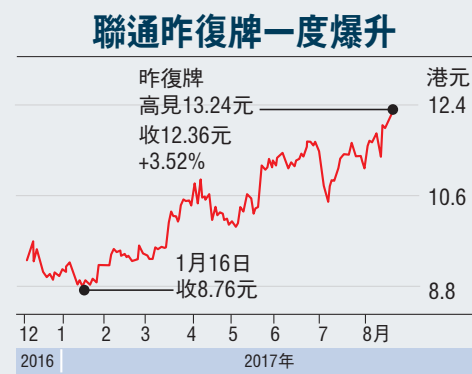
聯通昨復牌一度爆升