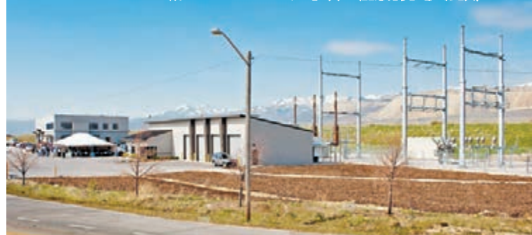
長建旗下公司EDL新收購位於美國猶他州鹽湖城South Jordan之堆填區沼氣轉化能源設施。

希臘之堆填區沼氣轉化能源資產。遠端能源業務則涉及擁有及營運多個分佈於澳洲全國的資產。