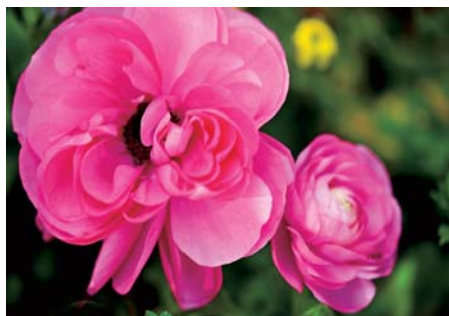
点的面积所占比例大，则可视为面

面强调的是构成元素的形状、面积和位置。面可由不同的点和线构成，也可由影调和色彩构成。面一般在整个画面中所占的面积比较大，视觉较为鲜明，更能表达拍摄环境和被摄体特征。