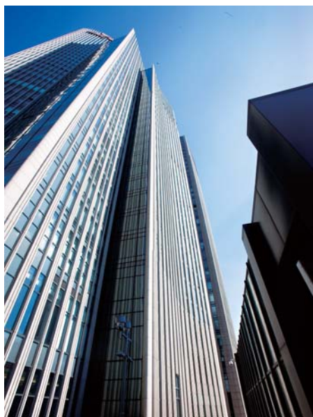
直线给人稳健的视觉效果

线条具有强调方向与外形的作用，可以看做点运动后的轨迹。线条有很多种，可简单地分为直线和曲线。在摄影中，合理地运用直线可给人以稳定、刚毅、力度的感觉，而曲线则给人以柔和、优雅且富于韵律的感觉。