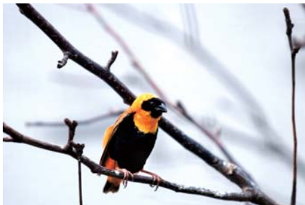
单点分布 光圈：F3.6 快门速度：1/500s 感光度：ISO100 曝光模式：光圈优先 曝光补偿：0

点、线、面是所有二维空间艺术形式的构成。一个较小的元素在一幅图中或者若干个元素同时出现在一个图中，我们都可以将其视为点。点在摄影中有聚集的视觉效果，与其他元素相比，点最容易吸引人的视线。点的数量与分布位置不同，所引起的视觉效果也就不同。最为常见的有单点分布和多点分布，分布位置则因审美需要而不同。