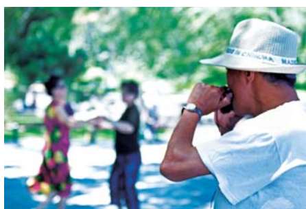
构图不同，情境变成老人们歌舞相交的和乐气氛 光圈：F2.8 快门速度：1/550 感光度：ISO100 曝光模式：光圈优先 曝光补偿：0