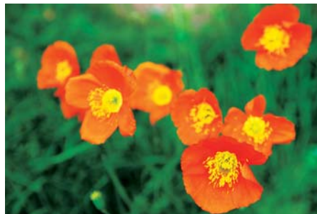
多点分布 光圈：F4 快门速度：1/640s 感光度：ISO100 曝光模式：光圈优先 曝光补偿：-0.3EV