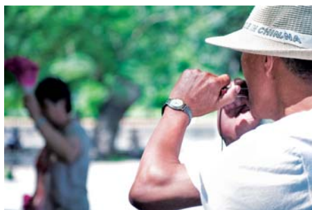
旨在突出老人吹口琴这一活动 光圈：F2.8 快门速度：1/550s 感光度：ISO100 曝光模式：光圈优先 曝光补偿：0

在摄影这门艺术中，构图是最基础的。当用取景器框取拍摄元素时，这实际上就是一个构图的过程。构图也是一个构思的过程，当拍摄者取舍被摄元素时，也就反映出拍摄者对这一画面的思考与艺术感受。