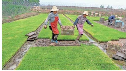
规模化育秧助农增收

5月13日,全椒县六镇镇一家合作社的农民在搬运秧苗。近年来,安徽省全椒县六镇镇通过“合作社+农户”规模化育秧,帮助农民增收。