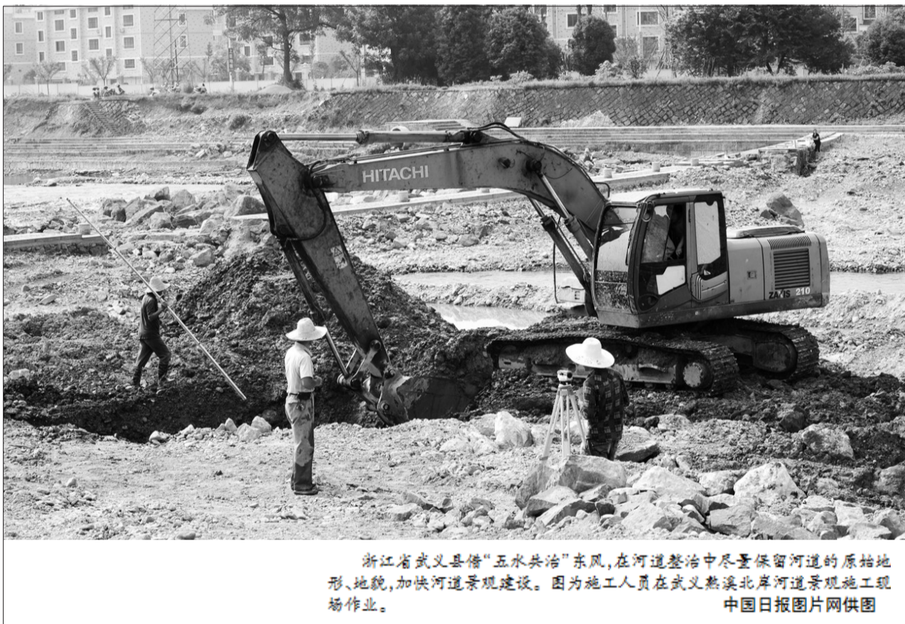
浙江省武义县借“五水共治”东风,在河道整治中尽量保留河道的原始地形、地貌,加快河道景观建设。图为施工人员在武义熟溪北岸河道景观施工现场作业。

据了解,福建省海峡环保基金会为非公募基金会,其宗旨和主要工作是通过支持和资助环境保护宣传教育活动及项目;支持和资助促进环境保护事业发展的科学研究、科技开发和示范项目;为化解各类环保危机做出贡献;支持和资助促进环境保护事业发展的交流与合作;支持和资助保护生态环境各项工作、促进福建省的生态省和生态文明建设和发展的活动及项目。同时,基金会还将开展海峡两岸的环保合作交流。 李良