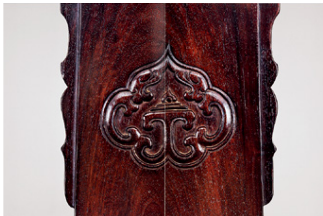
紫檀双龙纹背板圈椅：雕刻精美的纹饰