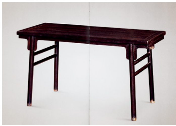
明代晚期·紫檀全素夹头榫平头案