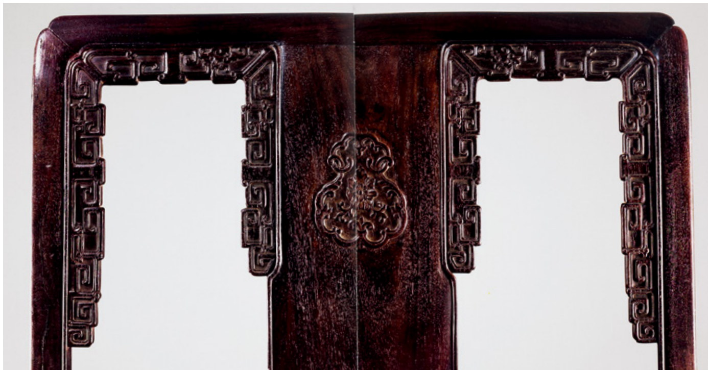
紫檀家具特有的“牛毛纹”

红木都有自己独特的毛孔，即“棕眼”，一般在打磨精细的红木表面可以见到。紫檀也有标志性的棕眼，就是著名的“牛毛纹”，打磨精致的紫檀表面都会见到似牛毛般的棕眼。为了完美体现紫檀的这一特性，雅昌摄影团队克服重重困难，尝试多种拍摄手法，终于拍出令人满意的图片。