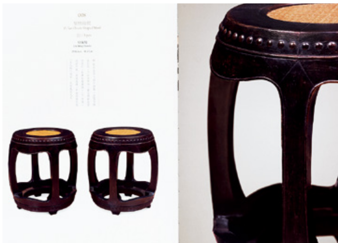
明代晚期·紫檀鼓凳

有大料，所以小件文房用具及摆设用紫檀木制作的反倒常见。由于紫檀木深沉的色泽经过打磨后闪着绸缎一样的光泽，在明朝低采光的房间显得雍容华贵，因而明朝对紫檀家具设计讲究光素，不追求奢华。