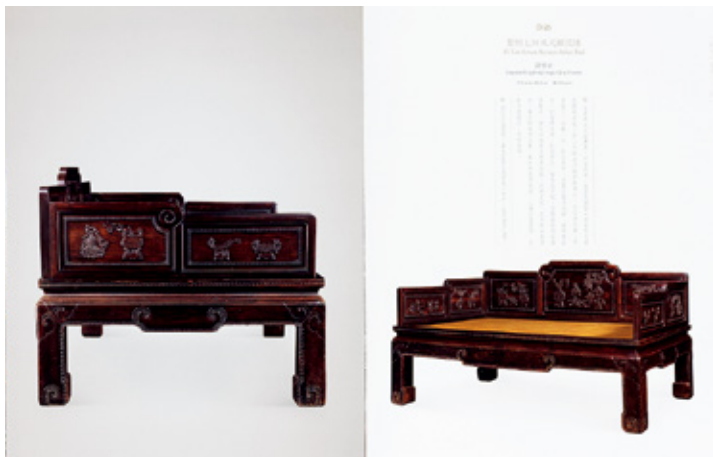
清代·紫檀七屏风式罗汉床

清代紫檀家具较之明代紫檀家具做了有益的探索，它把明代以来展现材料之美推向了展现工艺之美，两者难分伯仲。紫檀的材料之美体现在它与生俱来的质感与光泽之上，工艺之美则充分利用紫檀材料横向受刀无阻并可细腻表达的特点，让清紫檀在明紫檀之后浴火重生。