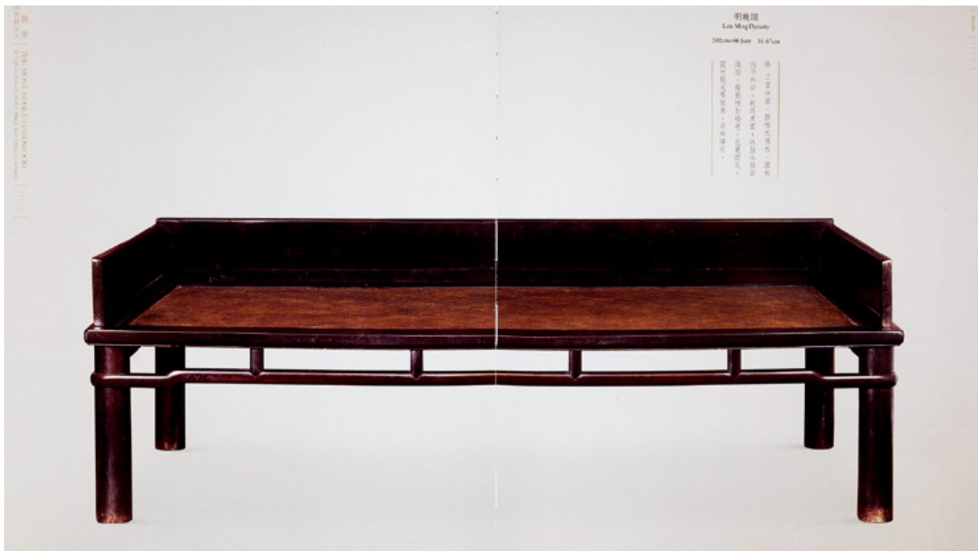
明代晚期·紫檀圆裹圆罗汉床