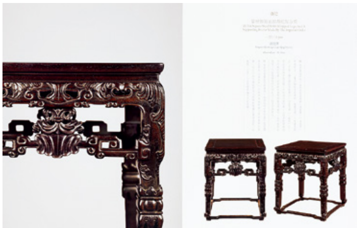
清代·紫檀御制裹腿带托泥方凳