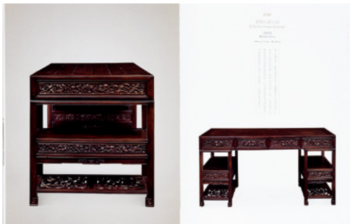
清代·紫檀六屉字台