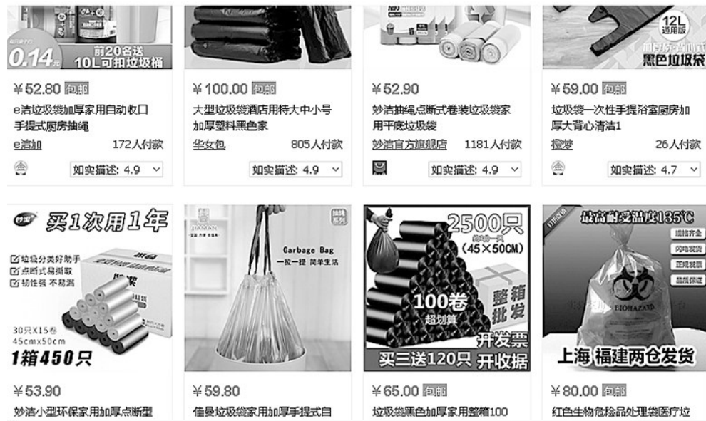
小小的垃圾袋成淘宝上的爆款。