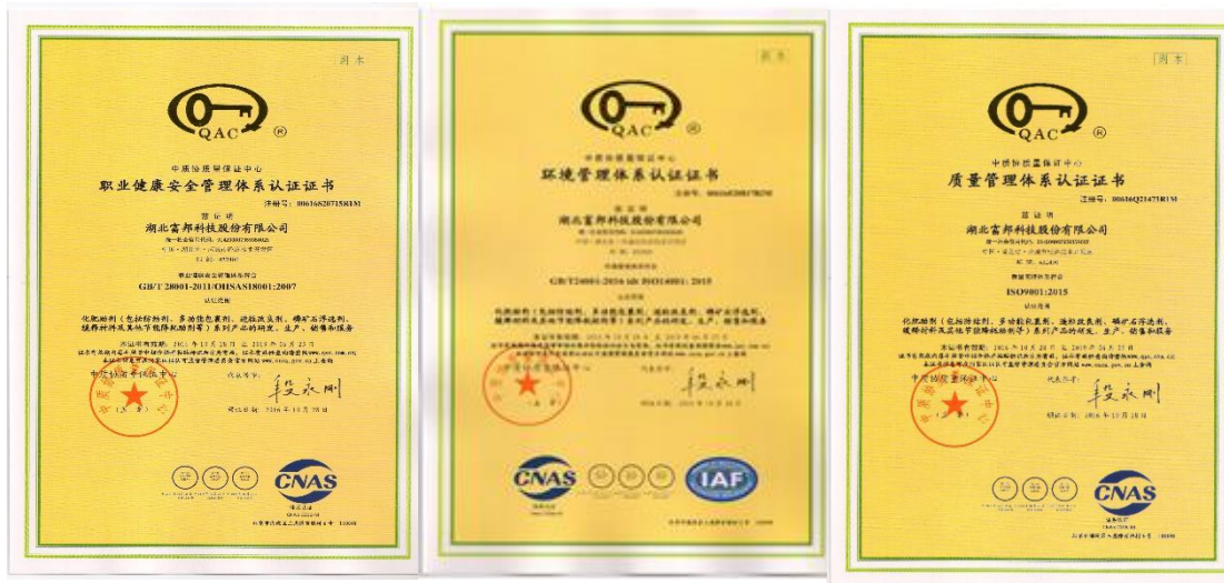
图 3：环境、职业健康安全管理体系认证