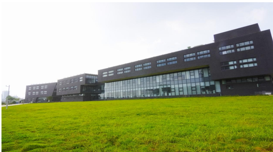
图 4：环境优美的光谷基地

公司严格遵守国家环境保护相关的法律、法规和地方环境保护有关规定，公司不存在重大环保或其他重大社会安全问题。公司在研发、生产、运营等各个方面大力推行绿色材料、绿色生产、绿色办公。在技术方面，公司优先选用可再生和环保材料，减少资源的损耗；在生产方面，优化工艺结构，推进清洁生产；在运营方面，推动无纸化办公，倡导绿色出行，积极导入先进生态理念，为构建环境友好型社会贡献自己的力量。