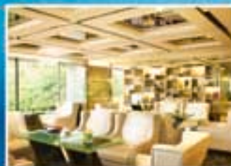
■ 富豪行政樓層貴賓廊