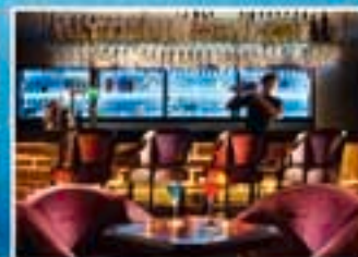
■ V Bar & Lounge