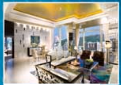
■ 御富豪行政樓層總統套房