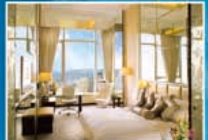
■ 御富豪行政樓層 Summit 高級客房