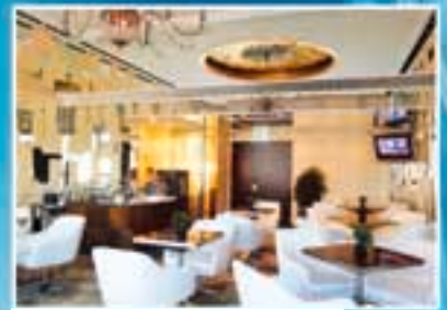
■ 御富豪行政樓層貴賓廊