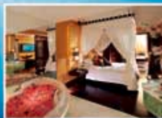
■ OM Spa 水療按摩套房