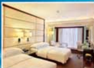
■ 富豪行政樓層高級豪華客房