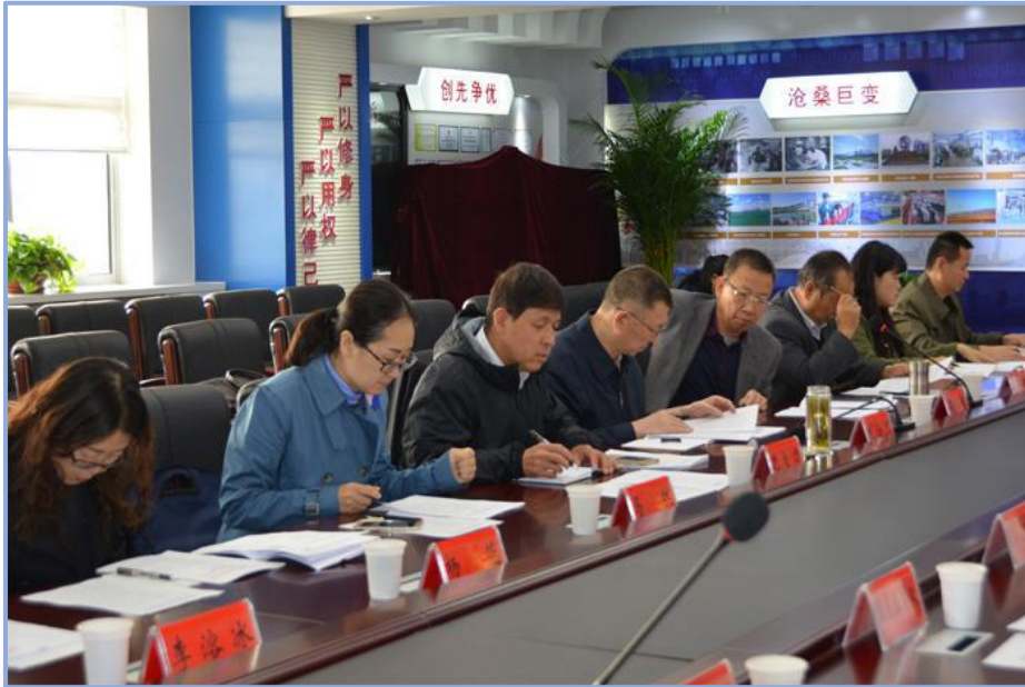
自治区政协副主席刘小河 率领督察组督查经信委提案办理工作

2017年，自治区经济和信息化委共承办自治区十一届人大七次会议代表建议和自治区政协十届五次会议委员提案70件，实现了办理工