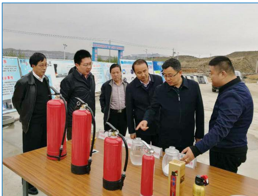
自治区经济和信息化委党组书记、主任 赵旭辉调研项目建设

制定公开了《自治区工业企业贷款风险保证金及补偿管理暂行办法》《宁夏回族自治区固定资产投资项 目节能审查管理办法》编制了《自治区工业企业技术改造投资指导目录（2017年本）》，及时公开了投资项目 管理改革政策落实情况。