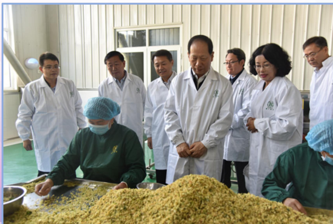
自治区党委书记石泰峰 调研宁夏利茶生物科技有限公司

为贯彻落实自治区党委书记石泰峰在宁夏民营企业家座谈会上的讲话精神，直接高效地为企业服务，实现行业主管部门与企业家在线交流、实时互动，高效解决企业面临的问题，按照《互联网群组信息服务管理规定》，组建了宁夏企业家（100户）微信群。