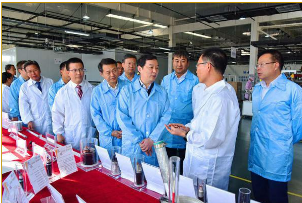
自治区党委常委、常务副主席张超超 调研光伏组件项目