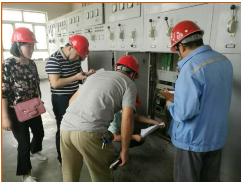
节能监察人员现场查验企业 计量器具配备和检定情况

加快推进工业绿色转型升级。制定印发《自治区绿色制造体系建设实施方案（2017-2020年）》，组织开展绿色制造系统集成工作，组