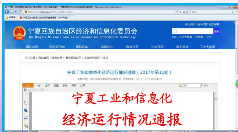
自治区经济和信息化委门户网站 政务公开栏目工业经济运行情况通报

及时公布《宁夏工业和信息化经济运行情况通报》《工业运行旬报》，反映工业经济发展质量和效益；公告市级人民政府年度节能目标责任评价考核结果等节能与综合利用指标，反映色制造情况。