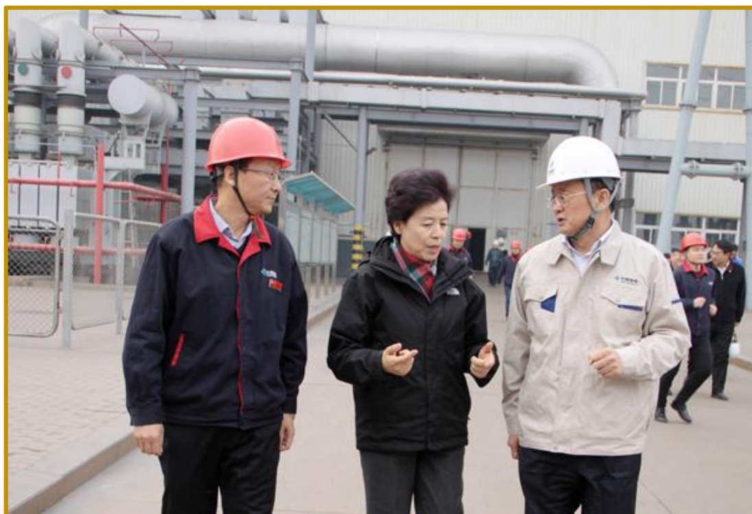
自治区主席咸辉在大武口热电厂调研

关注和充分肯定。12月8日，工信部以《工业动态信息专报》的形式向中共中央办公厅、国务院办公厅专报了宁夏推进工业领域需求侧管理的经验做法。