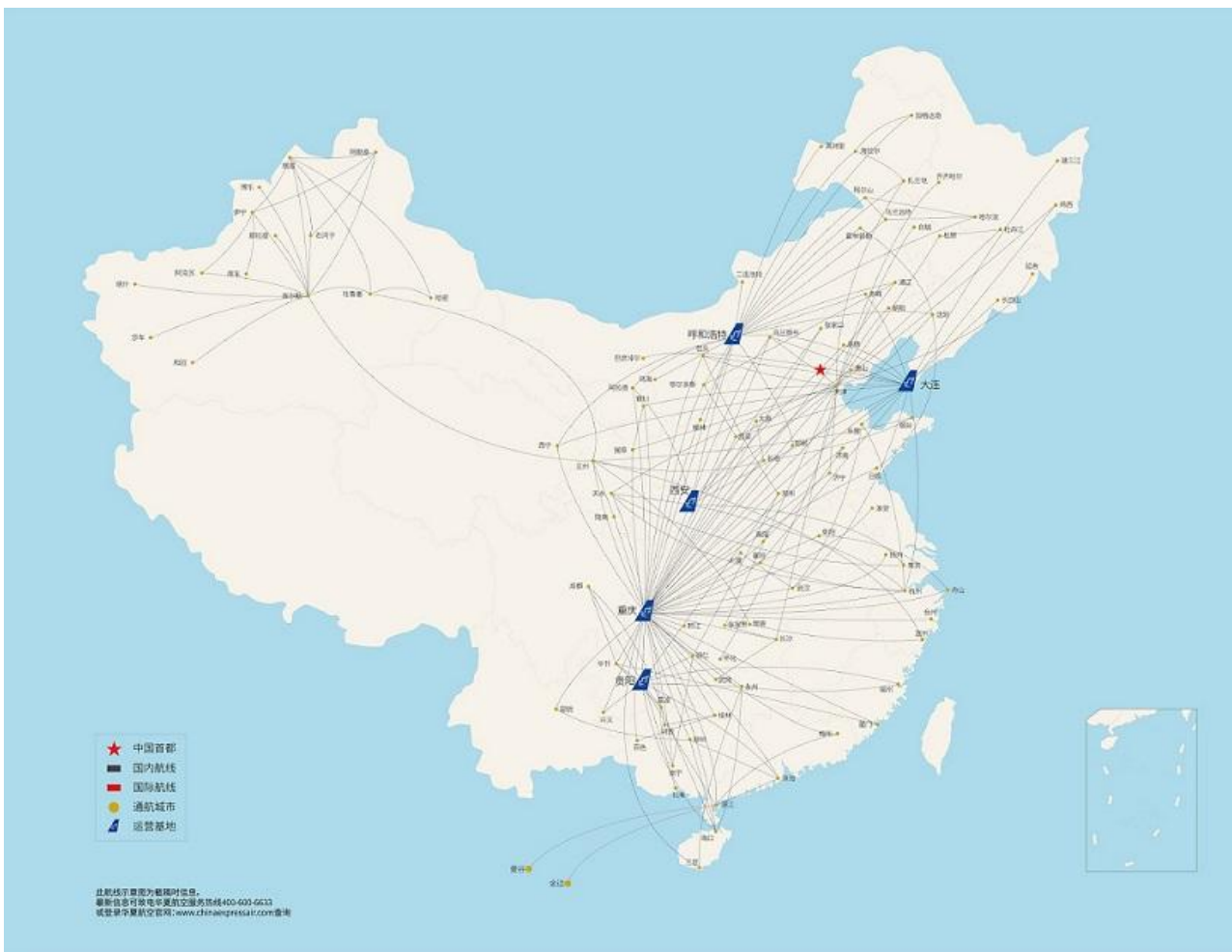
报告期末公司航线网络图