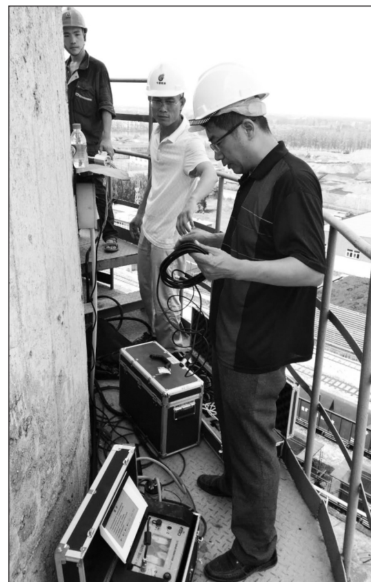
山东省邹城市环保局环境监测人员日前在兖州煤业股份有限公司鲍店煤矿,顶着高温,爬上离地面30余米的高空采样监测平台,对炉体内90度高温的烟气进行现场采样监测。