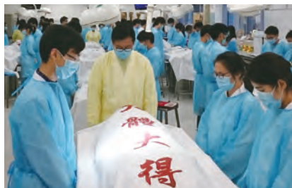
香港大學醫科學生向 “大體老師”遺體致敬