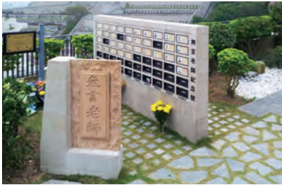
華永會將軍澳紀念花園 “無言老師”紀念壁