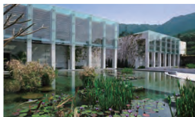
鑽石山火葬場 九龍黃大仙蒲崗村道199號 電話：2325 9996