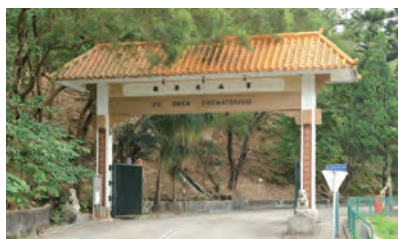
富山火葬場 新界沙田大圍下城門道 電話：2699 5090