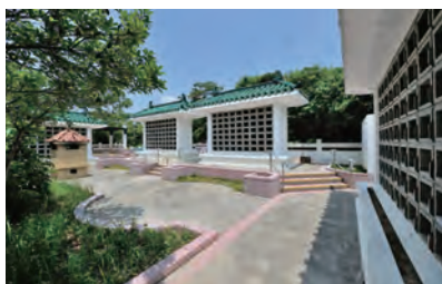
南丫島紀念花園 南丫島靈灰安置所 電話：2981 5177