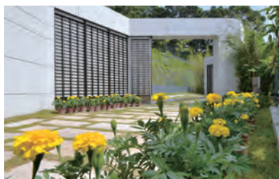
新和合石紀念花園 新界粉嶺橋頭路12號 電話：2696 4031