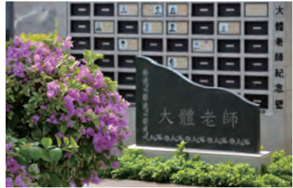
華永會將軍澳紀念花園 “大體老師”紀念壁