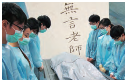
香港中文大學醫科學生向 “無言老師”遺體致敬