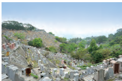
和合石墳場 新界粉嶺銘賢路 電話：2675 5296