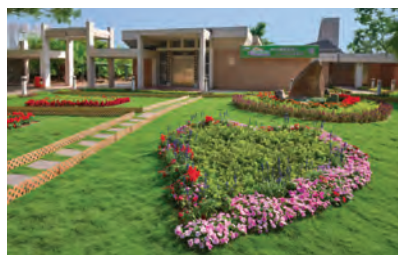
新葵涌紀念花園 新界葵涌永孝街11-13號 電話：2614 4390