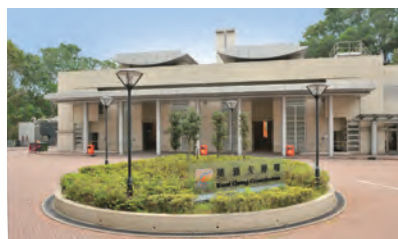
葵涌火葬場 新界葵涌永孝街11-13號 電話：2614 4390