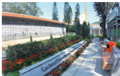
新哥連臣角紀念花園 香港柴灣哥連臣角道9號 電話：2556 1377