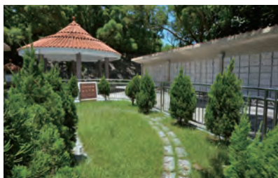
長洲紀念花園 長洲西灣長洲山頂道西 電話：2981 5177