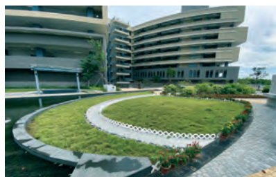
曾咀紀念花園 新界屯門曾咀稔灣路15號 電話：2713 1077