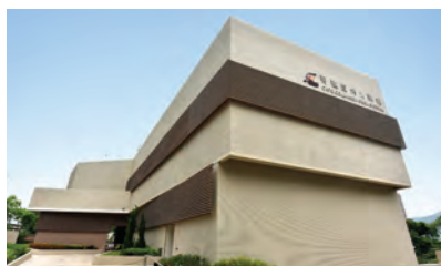
哥連臣角火葬場 香港柴灣哥連臣角道9號 電話：2556 1377