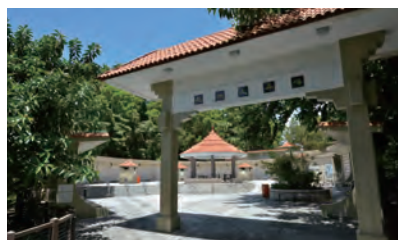
長洲火葬場 長洲西灣長洲山頂道西 電話：2981 5177