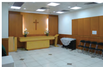
東區醫院內的「永寧軒」