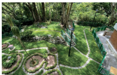
富山紀念花園 新界沙田大圍下城門道 電話：2699 5090