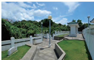
坪洲紀念花園 坪洲靈灰安置所 電話：2981 5177