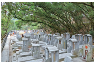
梅窩禮智園墳場 新界大嶼山 電話：2981 5177