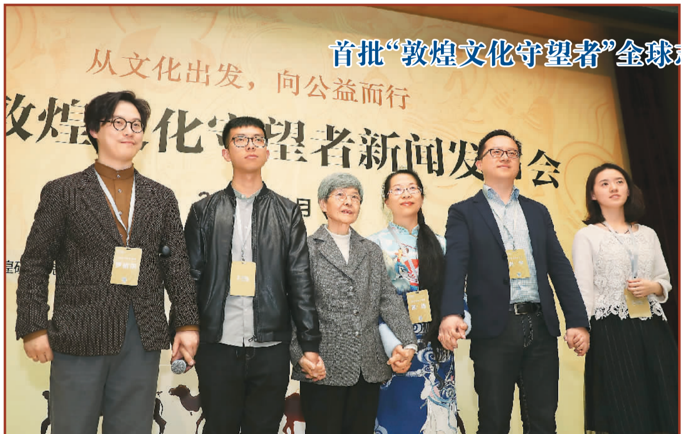
首批“敦煌文化守望者”全球志愿者出征