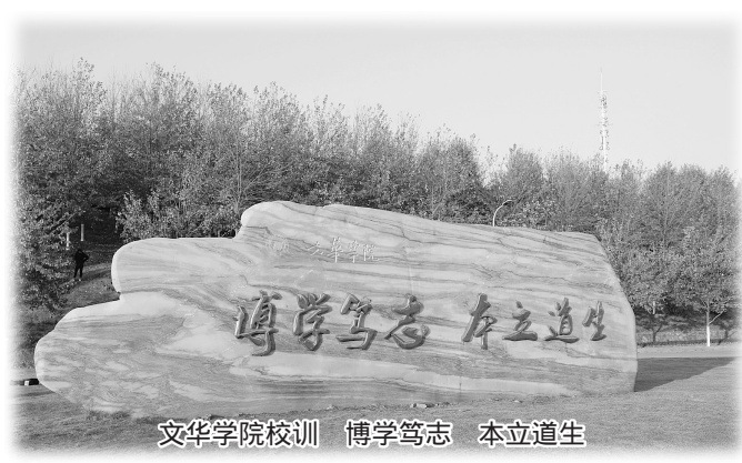
文华学院校训 博学笃志 本立道生

俗话说:舀给别人一瓢水,自己得有一桶水。文华学院的要求是:必须舀出一瓢优质水。优质水需要仔细过滤,优质课需要精心打造,最终的受益者是学生,呈现出来的成果是教学相长。