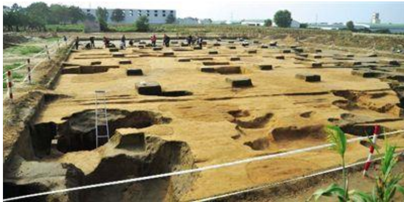
图 东赵遗址发掘现场