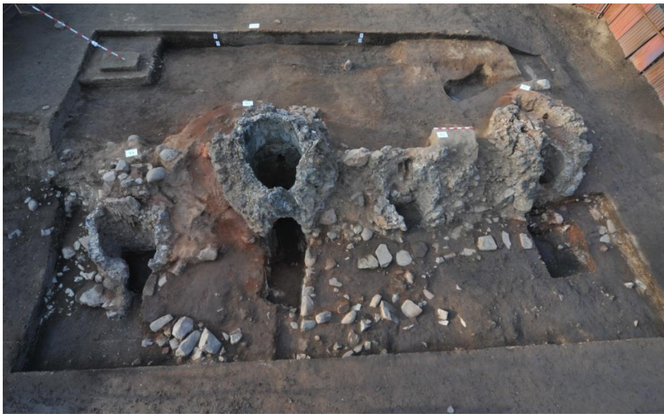
延庆水泉沟冶铁遗址出土的冶铁炉

同时，大庄科遗址群的发现具备一定的国际意义。它不仅反映了辽代接受、运用中原的生铁冶金技术的情况，也是辽代向西传播生铁冶金技术一个非常重要的环节。大庄科遗址群很可能是辽代冶铁技术自中原地区向其他边远地区传播的证据之一，也是中国古代生铁技术向西方传播的一支重要力量。