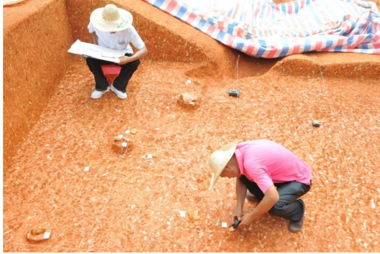
磨刀山遗址发掘工作场景