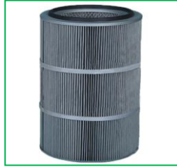
防静电滤筒过滤器