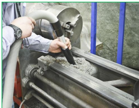
机械加工机床清理