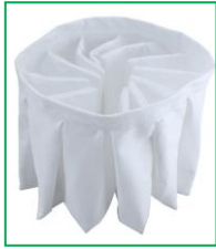
星型防静电布袋过滤器

滤筒过滤器采用表面镀铝膜处理，防静电性能好，表面电阻 \leq 10^5\Omega 。