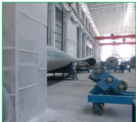
腻子打磨配套，车间清理