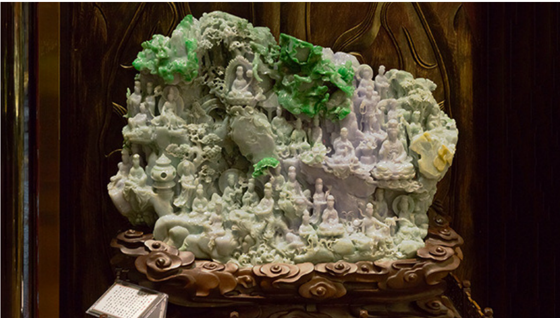
这是一件典型的翡翠山子。这件作品基本保留了原料的外形轮廓。翡翠山子通常要进行三维空间的雕刻。这件作品的体积硕大，即使从远处观看也让人震撼。场景由妈祖玉器提供。