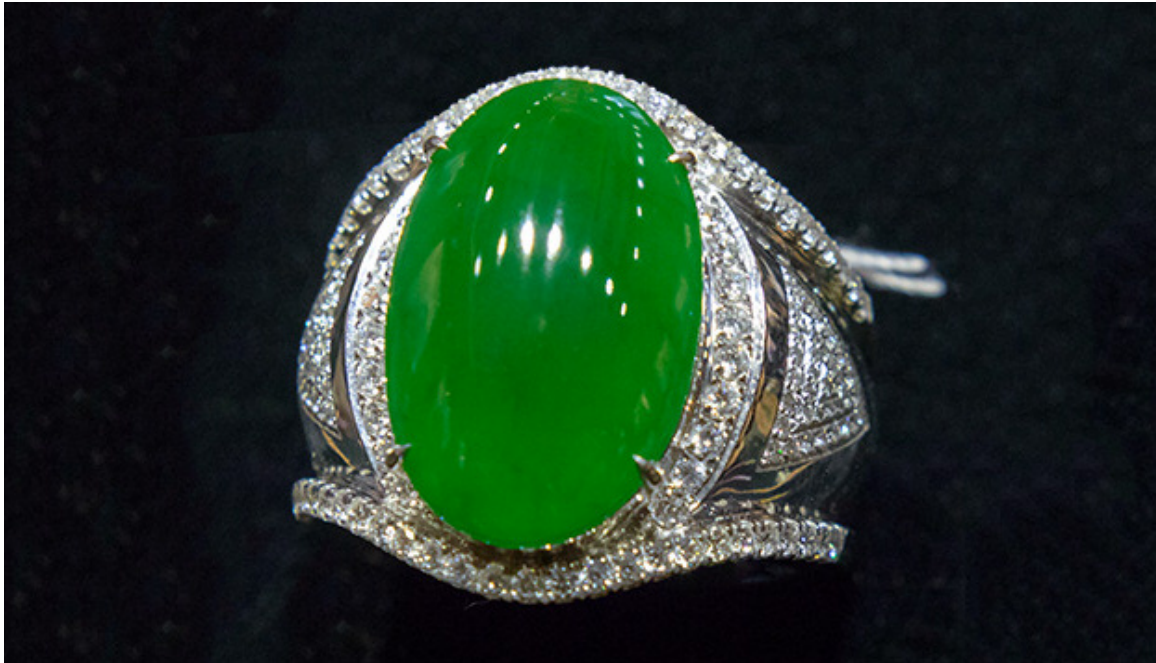
翡翠通常被加工成素面来作镶嵌之用。很多高品质的素面翡翠价值连城。场景由妈祖玉器提供。

玉常常被看成是中国的代名词。中国人对玉的崇拜和赏玩由来已久，甚至可以追溯到大约8000年以前。在翡翠从缅甸进口到中国之前，软玉一直主宰着中国的玉器市场。翡翠最初进口到中国的时间还一直是学者争论的话题之一，但很多人都认为不晚于明朝。