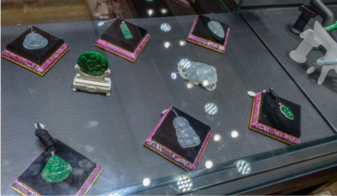
小的挂件，装饰件和手镯等是市场上常见的翡翠制品。

工匠们当然也用其他方法来制作翡翠成品。有些人将翡翠原料切片后在上面进行浮雕，然后再组合成整套的作品。这种加工方法可以让同样重量的原料产出更多的成品，同时还可以提高成品的透明度。