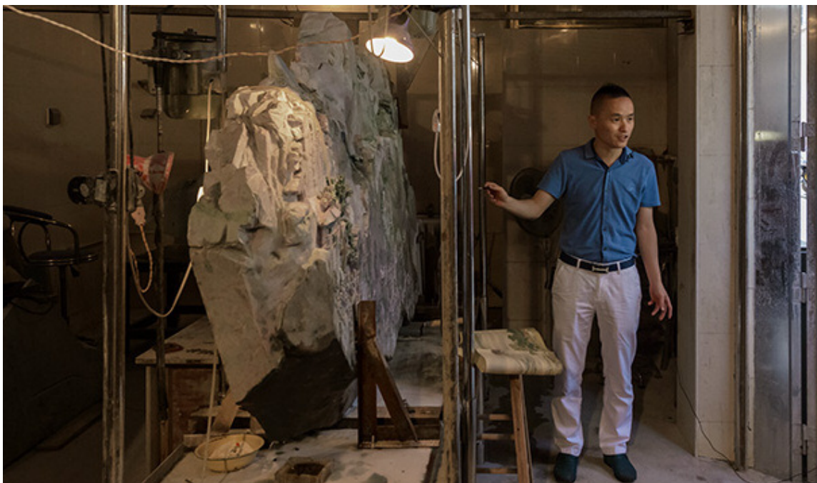
方先生向美国宝石学院的来访者介绍这项巨大的玉雕工程。场景由精玉满堂提供。

虽然方先生已经离开妈祖转而开展自己精玉满堂的业务，但他和郑老板的友谊还将继续下去。现在方先生正在向着自己的下一个梦想进发：他想要将自己的玉雕厂变成一个博物馆，专门收藏高端玉雕，并且希望用这些收藏来吸引全国技艺最高超的雕刻大师来到这里共同工作。