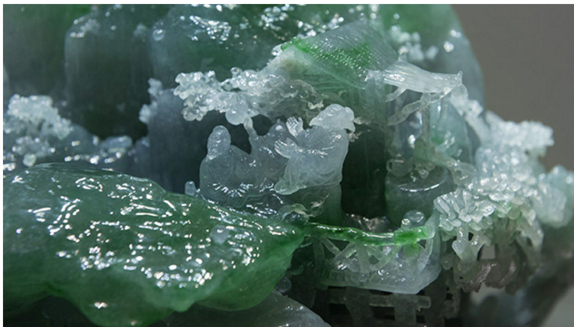
高品质的翡翠原料也被用来制作三维的翡翠山子。近距离观察时您会发现这件作品中一些人物形象的细节。

翡翠山子常用的雕刻主题包括风景、植物、传统吉祥符号、传世国画精品等等。主题的选择完全取决于原石本身的外形轮廓和颜色等因素。对翡翠进行设计和三维雕刻所用的工具和方法都是从软玉加工领域借鉴过来的。