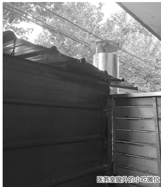
医务室窗外的小吃摊位