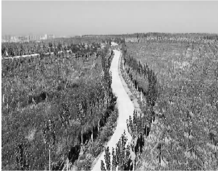
海州露天煤矿治理效果显著。

喷烟冒火的矸石山变成休闲公园,矿坑周边成了文化繁荣之地……辽宁阜新海州露天煤矿华丽转身。