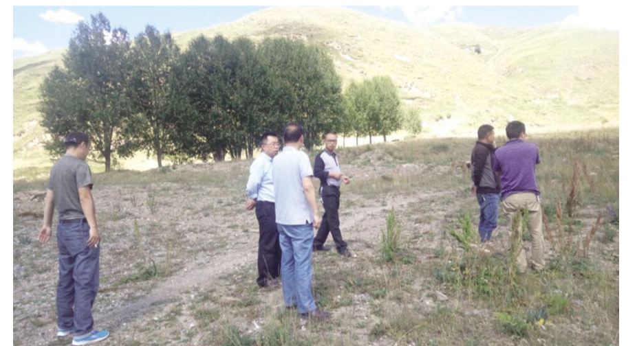
甘孜州邀请中藏药种植专家为甘孜县普玉隆村指导药材种植

抓好飞地园区建设。 加快推进成甘、甘眉园区道路、绿化、污水处理及功能配套、生态保护设施建设,积极争取上级部门政策支持,增强承载能力,提高综合配套服务水平。2018年,甘眉园区力争实现工业产值12亿元,增长26%;新开工建设项目2个,试生产项目2个,投产项目1个;成甘工业园区力争新签约项目2个,新开工建设项目2个。