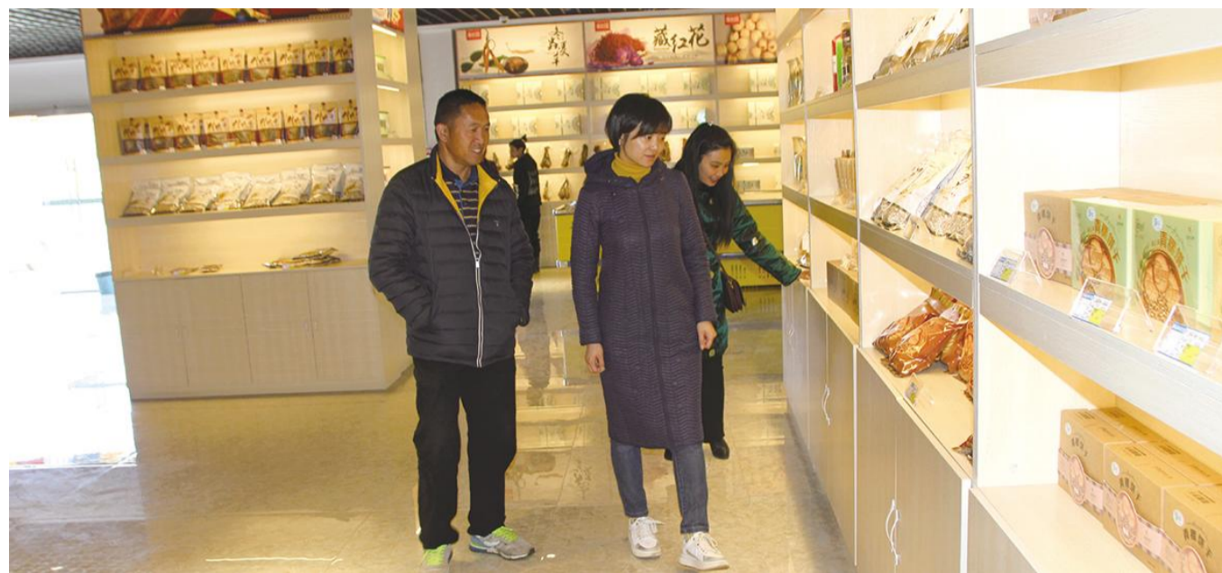
甘孜州经信委调研组内农产品加工企业

2017年,甘孜州经信系统认真贯彻落实上级决策部署,积极适应经济发展新常态,总体工作呈现健康持续发展的态势。2018年,甘孜州经信系统将以党的十九大精神为引领,全力实施“工业强州”战略,力争全部工业增加值增长9.5%。