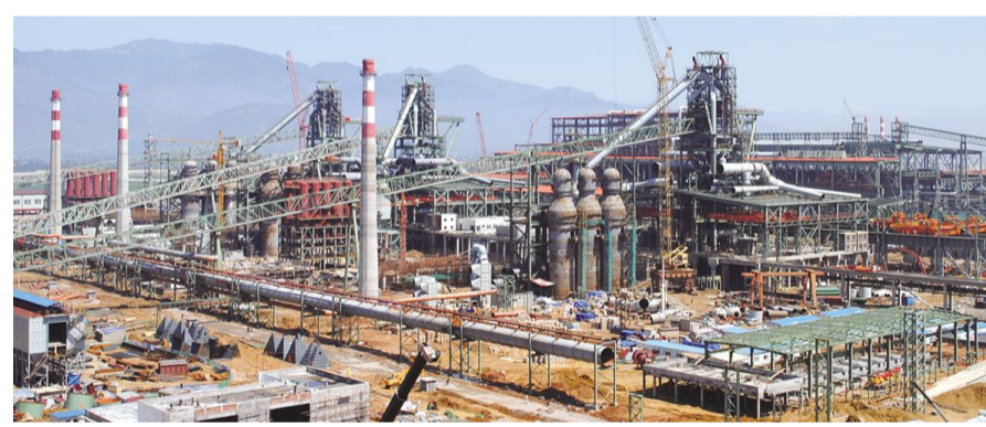
攀钢西昌钒钛资源综合利用项目建设现场

提升园区聚集发展水平,推进产业集群发展。 编制《凉山州产业园区创新发展规划(2017-2020)》,积极推进产业园区布局,深化园区改革,利用民族地区的税收政策、土地指标、留存电量等优势,积极推进对口帮扶的浙江省、广东省和省内发达地区建立“飞地”合作园区。加快推进“大众创业、万众创新”孵化基地建设,目前,西昌市已经建成1.5万平方米的孵化