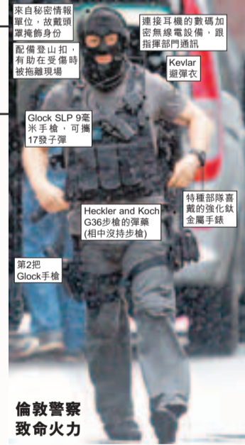
倫敦警察致命火力