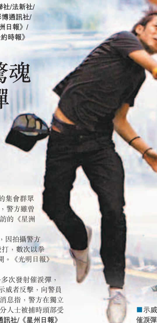
示威者向警方投擲催淚彈還擊。