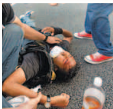
示威者與警方發生混戰，有示威者受傷倒地，頭部流血。