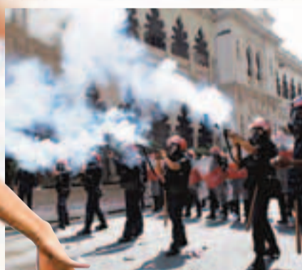
警方使用催淚彈(左圖)及水炮(右圖)鎮壓。