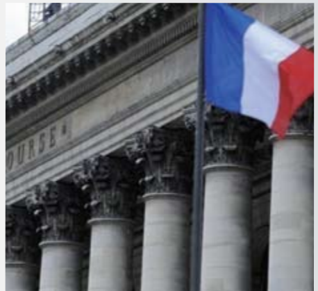
凯捷 1988 年在巴黎证券交易所上市并荣列 CAC40 指数，过去 5 年来股价表现优于 CAC40 指数公司的平均表现 * 法国 CAC40 指数：是法国最重要的股价指数，由巴黎证券交易所 (PSE) 以其前 40 大上市公司的股价来编制

资源高度融合，形成相互支持的网络化服务能力。借助凯捷独特的“协同业务体验”服务模式，凯捷中国团队与客户共同剖析业务需求的核心，为中国本土以及在中国的跨国企业提供全面和真正具有竞争力的解决方案及服务。