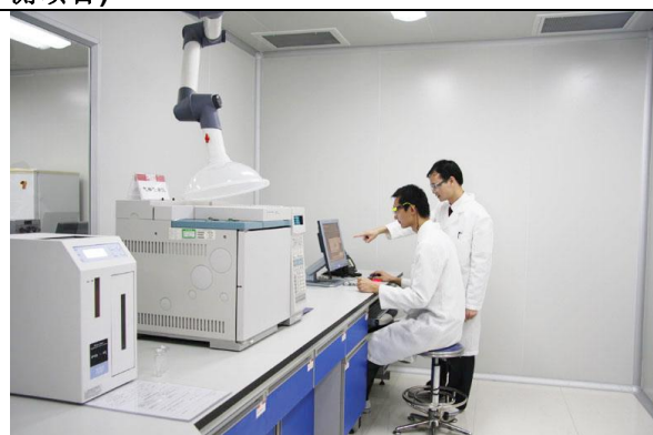
食品质量监督检测中心: 气相色谱仪(主要用于食品中农药残留、甲醇残留等项目检测)