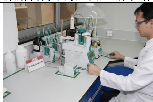
食品净化有机作业中心: 全自动电位滴定仪(可以检测水分含量及阴离子、阳离子活性物含量等检测项目)

绿谷氧吧·音乐广场 : 绿色, 七彩阳光的凝聚, 所有生命皆从绿色开始。在 音乐的气息中呼吸绿野, 在美妙的“声音”中与自然亲吻 。绿色是视觉上最容易被人们接受的颜色, 因为它的波长居中, 让人感觉稳定而平静, 象征着和平和安全; 它是大自然的主流颜色, 富含无尽清新, 以使大自然生生不息的活力得以延续。因此, 象征着希望、充实、文明、自然、健康和美丽。