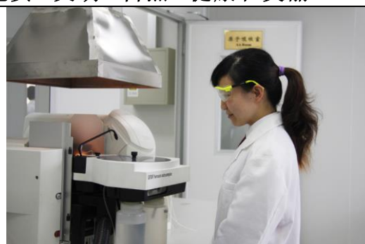
食品质量检测中心: 热原子吸收分光光度计(污染重金属: 铅、砷、汞、铜等元素检测)