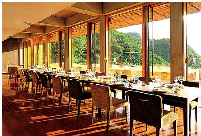
「依山傍水音乐镇」生态园(绿谷氧吧·音乐广场)景观咖啡屋

础,但可以缓解患者的症状和延长寿命(c),「心力衰竭非药物治疗进展给心衰患者带来了转机(c)」,「慢性阻塞性肺炎(COPD)的非药物治疗新进展,将给更多的患者带来福音(c)」,「高脂血症患者的非药物干预方法是有效的。经过非药物干预效果不显著的病例采用降脂药物治疗是必要的,但非药物干预应作为基础治疗(c)」,「非药物治疗可以显著降低血中坏的 TC(胆固醇)与 LDL-C(低密度脂蛋白胆固醇)水平,升高好的 HDL-C(高密度脂蛋白胆固醇)水平,是高脂血症患者的首选治疗方法及药物治疗的基础(c)」,「冠心病危险因素的非药物治疗(c)」,「非药物治疗能够较好地改善单纯舒张期高血压(IDH)患者的血浆 ADM(质肾上腺髓质素)、PGI2(前列环素)、AT2(血管紧张素 II)、TXA2(血栓素 A2)(c)」,「老年高血压、高血压治则和非药物治疗(c)」,「社区健康教育措施,对高血压病人实施健康教育,收到良好的效果(c)」,「糖尿病健康教育对糖尿病的非药物治疗有着重要意义;通过良好的健康教育能降减用药,甚至不用药,提高患者的生活质量(c)」,「失眠症非药物治疗具有安全有效,无论是与药物联合还是单独运用均起到较好的效果(c)」。