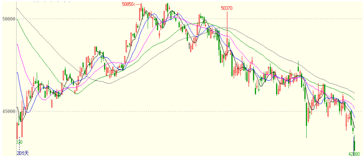
图一 13日沪铜1503合约K线走势图