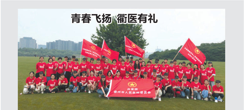
近日，衢州市人民医院团委开展了以“青春飞扬，衢医有礼”为主题的毅行活动。团员们沿着水亭门、衢州城墙、步行桥、西区大草原一路向西到达衢州展示馆。通过

实践中，逐步积累了深厚的文化底蕴，积淀了丰富的精神财富。正是凭着创司之初“憋足一口气，拧成一股绳，狠下一条心，共圆一个梦”