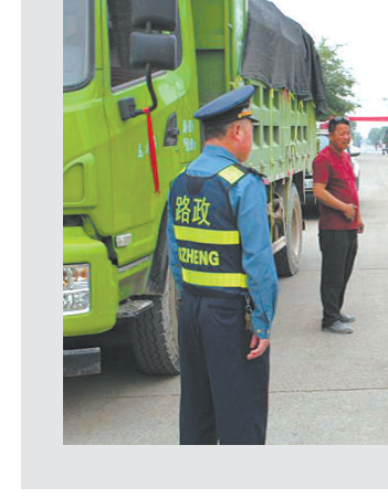
近日，龙游县路政、交警联合治超执法人员采取定点和流动执法模式，在320国道、315省道及县道陆社线等路段加大联合巡查力度。同时，执法人员深入高平桥水库及各建筑工地、混凝土搅拌站、砂场等源头企业开展现场管控，严厉查处超限超载、黄泥砂石料车厢不覆盖等车辆违法行为，确保全县道路安全畅通。因为路政、交警开展联合治超行动时，对违法超限运输车辆进行现场取证。

临安市乐平乡上沃蚕桑专业合作社注销清算公告：本合作社全体社员已决定解散本合作社，请债权人自接到本合作社书面通知之日起三十日内，向本合作社清算组申报债权登记，逾期不申报的视为没有提出要求。