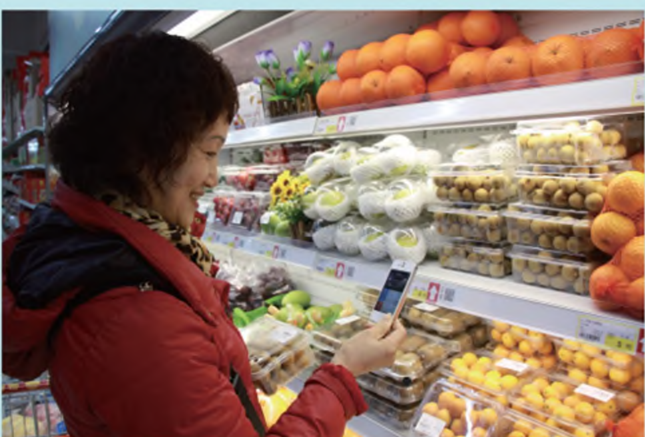
宁波市民在超市扫码查询果蔬来源信息。