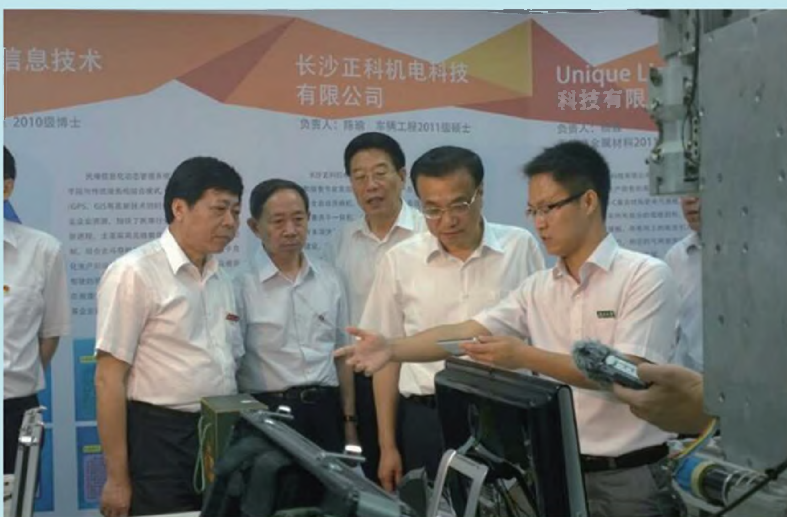
2015年7月，李总理视察湖南大学学生创业成果RFID生猪耳标芯片技术。

为解决群众消费安全问题，近年来，商务部分批支持58个城市建设肉菜流通追溯体系，支持18个省市及8家企业建设中药材及酒类流通追溯体系。