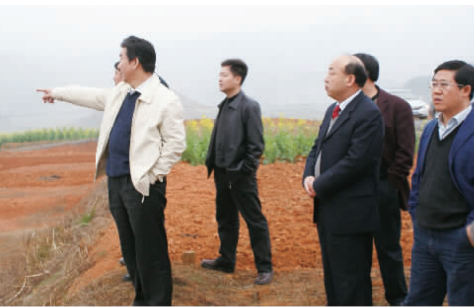
湖南省国土资源厅厅长陈三新(左一)实地检查工作。

为了确保“二调”工作顺利推进,各地采取得力措施,呈现三大亮点:一是用政府行为全力推进。有的乡镇负责人向县长递交了土地调查责任状;有些地方专门召开社区土地调查工作会议,进行政策宣传