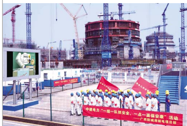
◀4月6日,中建电力防城港核电项目部成立了包括核级焊工在内的两支劳务工安全督察队,对岛芯重要区域进行风险识别。此外,项目还组织安全震撼影片观看等活动。