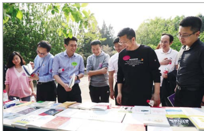
◀4月16日,局人力党支部承办集团人力系统第二届“读万卷书·行万里路”健走主题党日活动,集团在京单位90余人参加。大家通过徒步健走和荐书互赠推动支部党建与业务工作深度融合。

一次公益活动,将志愿者和社会各界的心连在一起。事实上,这样的爱心行动在西南分公司已经持续4年,也由此荣获重庆2018年度“最具关注奖”。未来,在参与地方经济建设的同时,西南分公司将努力承担更多社会责任,让爱的力量不断传递。