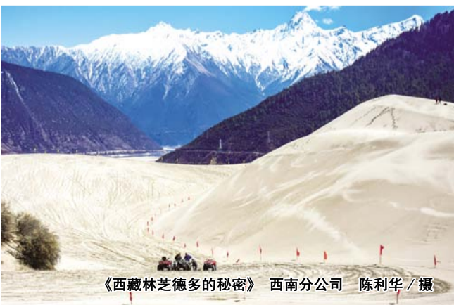
《西藏林芝德多的秘密》

一个人只有经历了，才得什么是成长。成长的道路上不会一帆风顺，但是风雨之后总会有彩虹，只要有信念在心中，不管路有多艰难，前方都是充满希望的。再雄伟庞大的工程都会有完工的时候，那时，我们的汗水与欢笑将会沉淀在这片土地上，工地生活，对我而言是人生的一种洗礼，是一笔宝贵的人生财富。