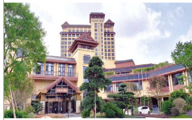
▲近日,深圳分公司广州长隆香江酒店项目竣工。该项目是长隆集团与局合作的首个项目,总建筑面积约4万平方米,建成后将作为集餐饮住宿于一体的高档酒店。陈李莹 文学/摄