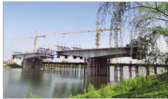
▲近日,投资公司武汉黄陂市政项目四联坑渡水河大桥支架现浇箱梁浇筑完成。该项目为黄陂区前川中环线东线工程,全长6.12公里,建成后将完善黄陂区主干路路网系统。

力将垃圾从高层运输到地面,还可能发生高层抛物等不安全事件。为解决这一难题,项目特意设计制作了8根长70多米、直径60厘米的纯钢套筒垃圾清理运输送管。此套垃圾清理运输系统的使用,不但节省了人工运输垃圾从而发生的较大的费用,还实现了工地垃圾清理运输的安全封闭性,实行了安全省力“双效益”。(熊炜 康磊)