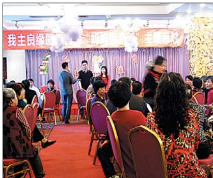
往期活动现场照片。

此外,活动以父母上台推介自己的子女为主。全程由主持人带领,活动准时开场。待父母们入座后,由男士的家长代表先上台介绍自己的儿子,详