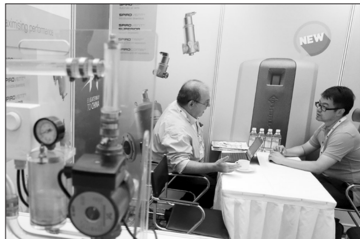
欧企中国门户项目日前在北京启动,44家欧洲环保企业赴华与中国企业在生物能、沼气、能源效率和节能技术、空气污染控制、废水处理等领域进行商务沟通,共商合作。

截至6月13日,中央第一环境保护督察组向河北省共交办13批群众信访举报问题线索1253件。其中,石家庄、唐山、保定最多,分别为316件、182件、147件。对于核查属实的问题,河北省采取了关停取缔、停产限产措施,并对相关违法企业进行了立案行政处罚及立案侦查,同时纪检部门对有关责任人进行了问责。