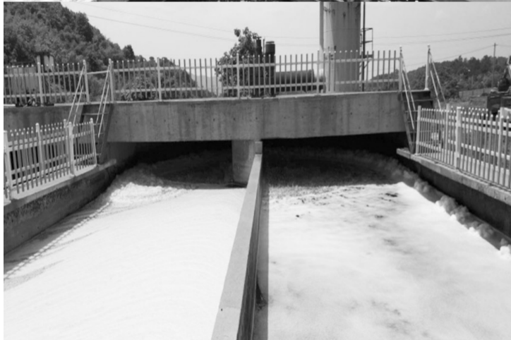
图为上饶市风顺生活垃圾处理有限公司垃圾填埋场氧化沟运行不正常。