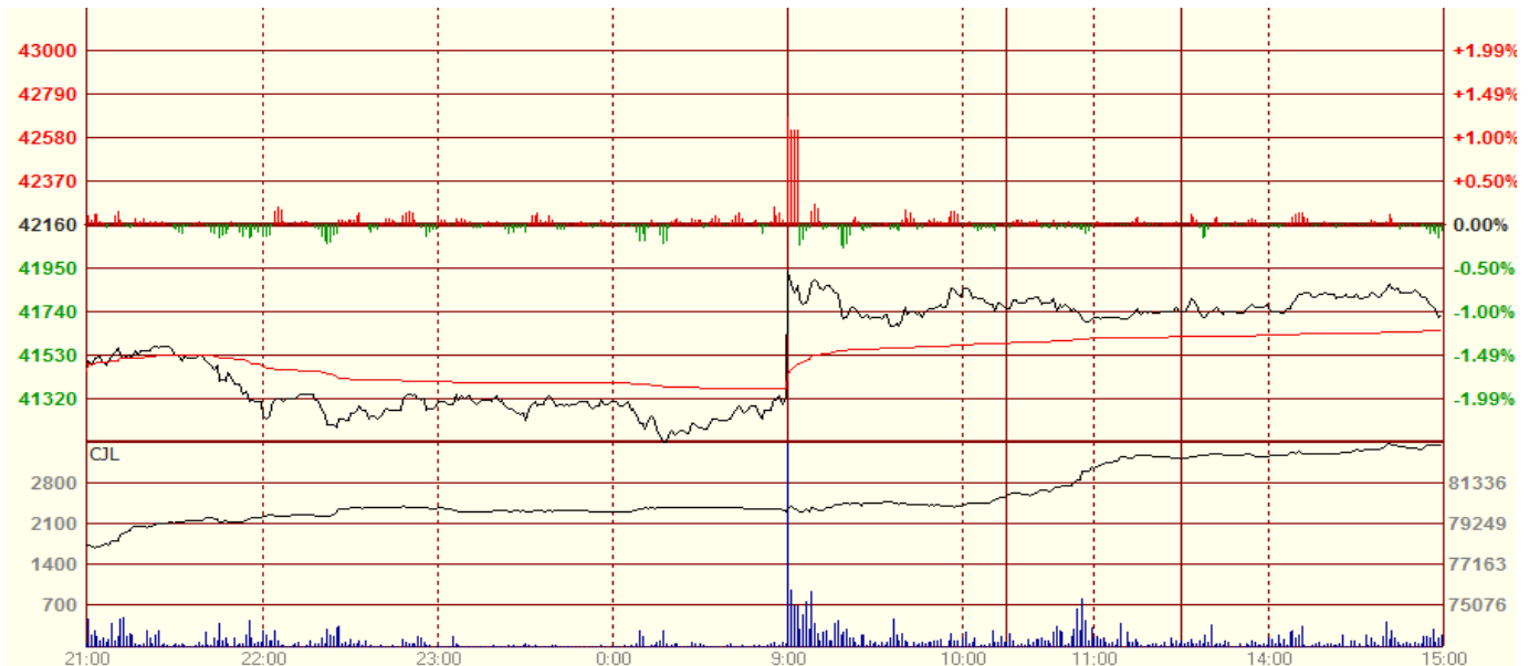
图一 17日沪铜1505合约分时走势图