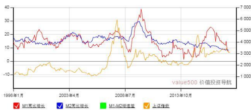
M1-M2 增速差与上证综合指数走势图

4. 燃油附加费 | 停征3年的国内航线燃油附加费将恢复征收。6月4日国航、东航、昆明航空等公司发布公告表示，将于2018年6月5日起（以出票日期为准），对国内航线燃油附加费进行调整。调整内容为：800公里（含）以下航线燃油附加费每航段由人民币0元上调为人民币10元；800公里以上航线燃油附加费每航段由人民币0元上调为人民币10元。按照行业惯例，其他航空公司预计也将很快宣布这一消息。