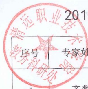
2019年度省级精品开放课程校内验收专家签名表(上午)