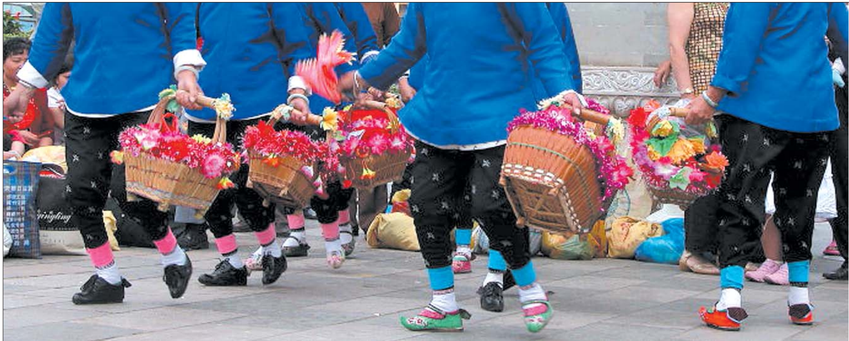
随着时光的流逝,三寸金莲越来越少了。(资料片)